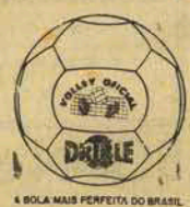
A BOLA MAIS PERFEITA DO BRASIL

"O ESTADO" apresenta nos dias destes catimenes votos de feliz e proveitosa viagem.