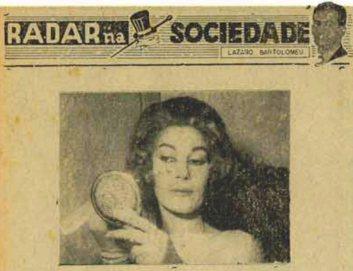
CACILDA BECKER, famosa atriz do Teatro Nacional, vai acontecer na "Floriacap" — promoção do Departamento de Cultura da S.E.C.