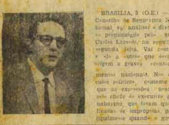
BRASILIA, 3 (OE) — O Conselho de Segurança Nacional vai analisar o discurso pronunciado pelo gov. Celso Lacérda, na próxima reunião desta. Vai analisar o discurso que deverá ser pronunciado no Conselho Nacional de Segurança Nacional, em especial, sobre o pronunciamento do país.

de por ser este jornal on bilidade a primeira página de a rebelião militar. — Costaram as operações nguas. A informação de a contida não comunicada a secretaria provisória de ma rinha, citando mensagem recebida de "homagem" a frota de guerra argentina.