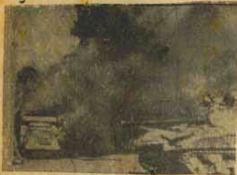
TANQUES FORAM ATACADOS PELA AVIAÇÃO NAVAL