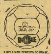
• BOLA MAIS PERFEITA DO BRASIL

trabalhos da sessão invernal do "Concílio Nacional das Igrejas". A delegação inclui representantes das igrejas ortodoxas, da Igreja ortodoxa da Geórgia, da Igreja armênia, da União dos Batistas evangélicos-ortodoxos e das igrejas evangélicas luteranas da Estônia e da Letônia.