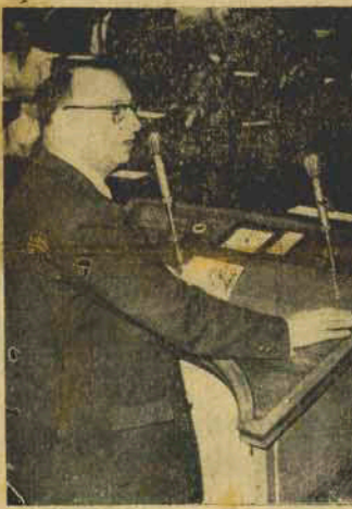
No flagrant Heinrich Alberts, no Senado, de Berlim