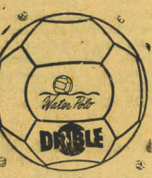
A BOLA MAIS PERFEITA DO BRASIL.

A "negra", disputada anteontem em Porto Alegre, pela Taca Brasil entre Bolafogo do Rio e Internacional local, terminou favorável ao Campeão carioca que, assim, está classificado para disputar a final com Santos ou Náutico.