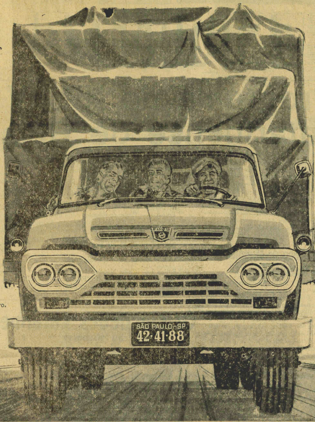
Nôvo Super Ford F-600 — o mais moderno caminhão brasileiro.

P.S. Ao comprar o seu primeiro caminhão, escolha o Nôvo Super Ford!