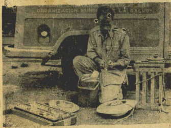
1902 — 2 de dezembro — 1962 (Foto)

O jovem entomólogo da Guatemala que se vê na gravura está colocando no gelo um mosquito vivo, pouco antes capturado. Assim procede para manter vivos quaisquer vírus de febre amarela de que o mosquito possa ser portador, o que é da maior importância para os exames de laboratório e para a compreensão da doença.