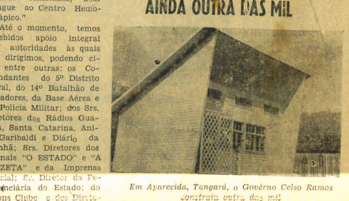
Em Aparecida, Tangará, o Governo Celso Ramos construiu outro dos mil

"Até o momento, temos recebido o apoio material das autoridades às quais nos dirigimos, podendo citar, entre outras: os Comandantes do 5º Distrito Naval, do 14º Batalhão de Caçadores, da Base Aérea e da Polícia Militar; dos Srs. Diretores dos Rádios Guarsul, Santa Catarina, Anita Garibaldi e Diário da Manhã; Srs. Diretores dos Jornais "O ESTADO" e "A GAZETA" e da Imprensa Oficial; Sr. Diretor da Ferrovil; do Estado; do Lyons Clube e dos Dire-