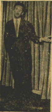
Transcrito da A Revista do Sul, nº 147 de agosto p.p.

aos domingos, às 21 horas. Um jovem catarinense, dono de uma voz realmente bonita, já figura no rol dos cantores. Reside em Copacabana, na Belascp. Gavou seu primeiro disco em começo de abril e já está providenciando o segundo, e, temos certeza, há de continuar gravando.