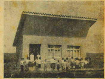
Na foto, a unidade de Morro do Sul, no município de Jacinto Machado.

A linha de transmissão já está em funcionamento de alto significado do para o desenvolvimento econômico da região. CONTINUA AINDA DAS M.L. O Grande Gramadilha, Vamos todos ajudá-la. Quem faz tanta escolhinha Sabe mesmo governar!