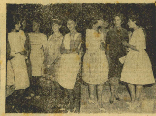
Um grupo de Debutantes para o Baile da Menina Moça, discutem seu 1.º vestido de baile.