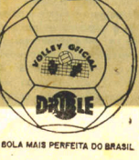
A DOLA MAIS PERFEITA DO BRASIL

lobulo da orelha. Na hipótese de tratar-se de grande operação (supressão das rugas existentes na fase da grande operação) (supressão das rugas existentes na face, pescoço e da nuca) proveniente de uma frouxa idade ou talvez o corte seja prolongado por detrás do pavilhão articular. Para eliminar as rugas da testa pratica-se uma incisão pouco acima da inserção dos cabelos, corte esse que deixará cicatriz invisível por se tratar de uma região pilosa. As rugas do canto dos olhos, comumente chamadas "pés de galinha" e as sobranceiras também encontram, também por essa técnica, um meio de fácil correção. As rugas existentes em cima ou em baixo das papébras assim como as bolsas sob os olhos (poches dos olhos) são também eliminadas pela cirurgia estética. A papadas verdadeiras e que são aquelas em que existe um depósito de gordura em baixo do queixo não se beneficiam com nenhum dos tipos de operações já descritas anteriormente. É necessário, uma incisão no próprio local (in fra mandibular). São esses, do modo mais simples possível, os métodos comumente usados para a correção cirurgica das rugas, mas é conveniente lembrar que não há uma técnica definitiva, aplicável a todas as pessoas. NOTA: Os nossos leitores poderão solicitar qualquer conselho sobre o tratamento da pele e cabelos ao médico especialista Dr. Pires à rua México, 31 - Rio de Janeiro, bastando enviar o presente artigo deste jornal e o endereço completo para a resposta.