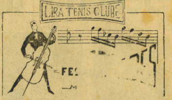
LIRA T. C. - SABADO DIA 14 - GRANDE SOIRÉE COM JUCA CHAVES CARTAZ DA ATUALIDADE - MÉSAS NA RELOJOARIA MULLER