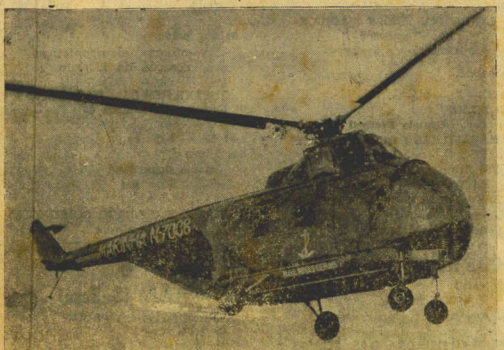
Este é um dos helicópteros da Esquadra Brasileira. Com capacidade para transportar um pelotão de fuzileiros, paraquedistas ou grupos de demolição, pode facilmente ser transformado em ambulância para o transporte de feridos.

IMIGRANTES — Como principal porto do litoral Atlântico, Nova Iorque tornou ponto central do fluxo de imigrantes vindos da Europa. Muitos deles procurando liberdade e oportunidades novas, eram Nova Iorque em busca de outras cidades maiorias ali ficou. Foi Torque, cédo, se tornou conhecida como o "Cádmus de raças" devido as diversas nacionalidades de seus habitantes.