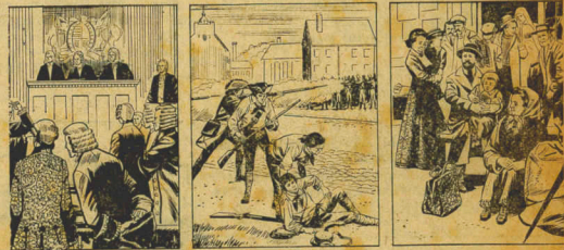
(cont. da 2ª pag.)

RIO, 30 (V.A.) — Fazendo um lançamento em massa de centenas de pára-quedistas e diferentes tipos de materiais de guerra sobre o Campo do Gramacho, o Núcleo da Divisão Aeroterrestre comandou, ontem, o salto nº 200 mil. No ensejo a Força Aérea Brasileira também inaugurou, oficialmente, o emprego dos seus aviões C.119 em operações dessa natureza. Representou o presidente da República na solenidade o subsecretário de Guerra, gen. Machado Lopes. O comandante daquela divisão, gen. Santa Rosa, saltou com o pára-quedista popularmente conhecido como "periquito", multicolorido.