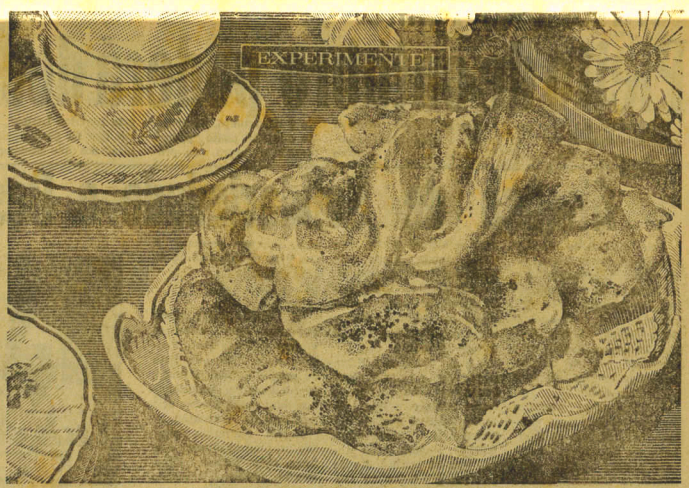
Esta é uma receita aprovada pela "Cozinha Royal". Prove estes pãezinhos com Chá Tender Leaf!

Sentimo-nos, pois, inteiramente a vontade para expressar-lhe nossa convicção — já não mais dizemos esperança — de que nossos problemas regionais relativos à ampliação e melhoria do parque industrial e a concessão do crédito serão estudados por Vossa Excelência e um preclaro equipe com objetividade e simpatia obtendo solução conveniente e desejada. Ao finalizar, em nome de todos os comerciantes e industriais desta região, e ainda em nome dos visitantes que nos honram com sua presença e nos acompanharam nesta homenagem, desejamos a Vossa Excelência e a dinamizada comitiva uma feliz estada entre nós, formulando os melhores votos de sua felicidade pessoal.