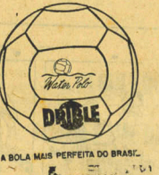
A BOLA MAIS PERFEITA DO BRASIL.

Vende-se ou permuta-se uma boa casa, à rua Dr. Fúlvio Aducci no Estreito. Vende-se outro pequeno, situado em ótimo lote à rua Antônia de Barros. Tratar a rua Abelardo Luz, 57 no mesmo bairro.