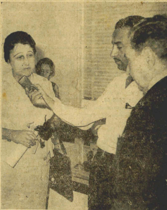
A Primeira Dama do Estado agradece as homenagens prestadas ao Chefe do Executivo catarinense, pelo Serviço Social da Indústria, na qualidade de fundador e pioneiro daquela entidade

Ato contínuo, realizou-se a entrega aos servidores