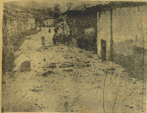
RANRAHIRCA, Peru — Restantes índios desta aldeia passaram ao longo de uma pequena rua que escapou da destruição do recente aluá que desceu das montanhas locais, matando de 4 a 4 mil pessoas. Os sobreviventes do desastre foram apenas algumas centenas.

DIRETOR RUBENS DE ARRUDA RAMOS GERENTE DOMINGOS FERNANDES DE AQUINO ANO XLVIII N.º 14357