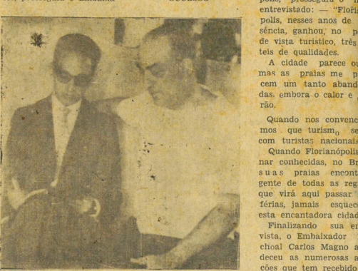
O Embaixador Paschoal Carlos Magno quando prestava declarações à Reportagem.

Embaixador Paschoal Carlos Magno: "É verdade que depois de muitos anos de silêncio, autorizei a reedição do meu romance 'Sol sobre Palmeiras' que está obtendo sucesso, invulgar." COORDENAÇÃO DE ENERGIAS. Referindo-se ao IV.º Festival de Teatro de Estudantes, prosseguiu o Embaixador