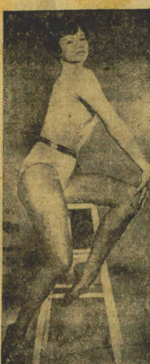
Esta é Juliet Prowse, a quem Frank Sinatra propôs casamento. O noivado entre o cantor e a bailarina foi anunciado oficialmente por Sinatra, que, todavia, não revelou a data do matrimônio, insinuando somente que será "para breve".