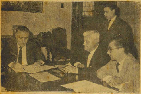
Governador Celso Ramos assinando decreto que regulariza a situação dos professores diaristas. No flagnante, além do Chefe do Executivo, vemos o titular de Pasta de Educação e Cultura...