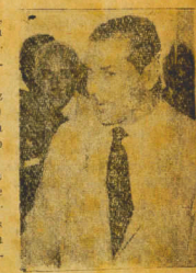
sões informaram que foram tratados assuntos administrativos do Rio Grande do Sul.

BRASILIA, 29 — O governador Leonel Brizola, conferenciou com o sr. João Goulart da manhã de hoje. Na hora do almoço ambos foram para o Palácio da Alvorada. Asses-