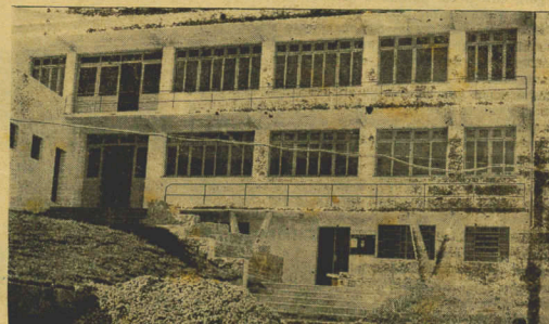
O flagrante acima, da fachada do R. U. dias antes de sua inauguração, mostra bem a capacidade do estudante universitário catarinense. (Foto na 6.)