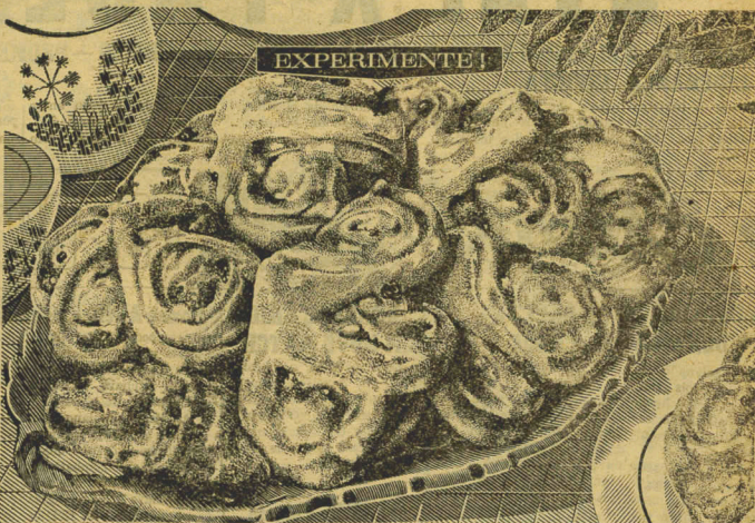
Esta é uma receita aprovada pela "Cozinha Real". Prove estes docinhos com Chá Tender Leaf