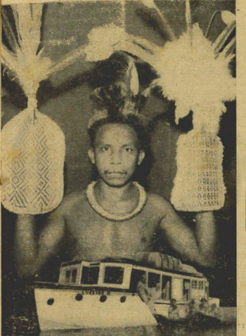
IAPÉ Cacique dos Saterés — Amazonas com as lvas da dança da tocadeira

Recebe então, um regime especial, pois passa a ser alimentada com sabatá (formiga), que é preparado no pilão, embrulhada em folha de caxirica, depois lavada no fogo e ali está pronto o regio prato Usam também "Iapeui" manhuira) outra qualidade de formiga. Miolo de côco de Babaçu (palmeira), "Urupe" resina de pau podre, assada, pásaros especiais: tuacuro e inhambuzinho.