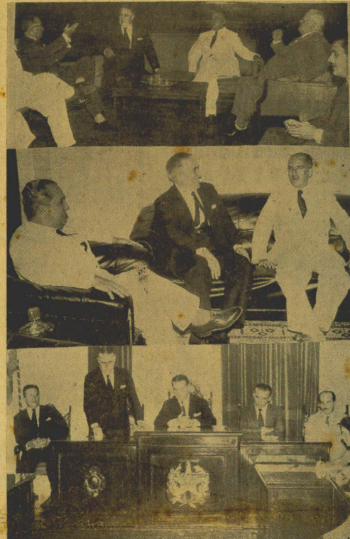
O governador Celso Ramos, acompanhado do Chefe da Casa Militar, do Chefe do Cerimonial e do Chefe do Gabinete de Relações Públicas do Palácio, reali... za, no tarde do dia 22, visitas oficiais ao Tribunal de Justiça, Tribunal Re...