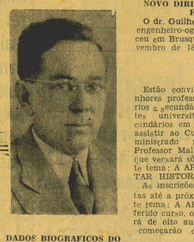
NOVO DIRIGENTE DA FIESC

Alvorada vg em Brasília às 22 horas do dia 31 de corrente pt Traje Bp Uniforme ou casaca com decorações e Agradeceira o obsequio de uma resposta vg no prazo máximo de cinco dias vg para adivida do Sr. Celso Ramos, Ministro das Relações Exteriores vg Rio de Janeiro pt Atenciosamente Horácio Lacerda Ministro de Estado das Relações Exteriores"