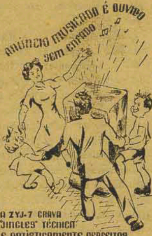
A ZYL-7 CARVA JÚNICOS TÉCNICO & ARTISTICAMENTE PERFEITOS

Onda média: (5 KW) 1420 kcs. Onda curta: (10 KW) 5975 kcs.