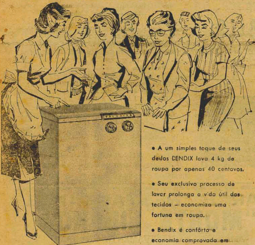
Assista a uma demonstração sem compromisso

- a mais moderna lavadeira automática do mundo