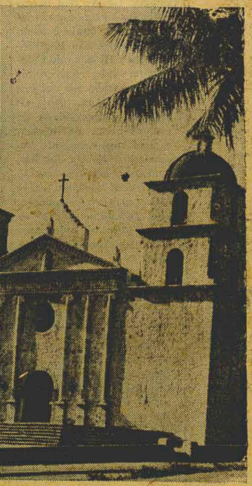
O primeiro ato da cerimônia é celebrado na véspera de Natal, com a Bênção da Mangedora, onde é colocado pelo Padre, o Menino-Deus, numa sinela revivescência da cena do nascimento de Cristo em Belém. O Altar-Mór da Igreja da Missão é ornamentado para a Missa do Galo, com flores e plantas originárias da própria região de Santa Barbara, desde a época da fundação da Missão, pelo famoso padre espanhol Junipero Serra. A Igreja da Missão de Santa Barbara, onde está sepultado o primeiro Bispo da Califórnia, foi a primeira catedral levantada neste Estado, encontrando-se hoje, no mesmo local onde foi construída há quase 2 séculos.