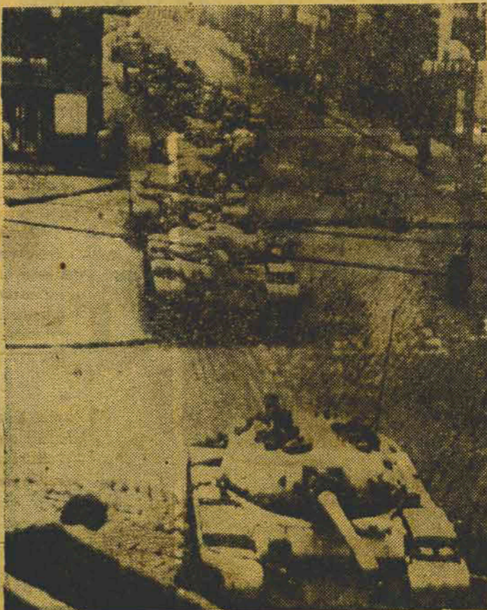
BUDAPESTE — Desfilam pelas ruas da capital húngara inúmeros tanques soviéticos, preparados para entrar em ação contra os rebeldes que se insurgiram, exigindo a retirada de todas as tropas russas de ocupação do país. Ao fundo, à direita, populares observam a passagem dos tanques soviéticos.

Pronta entrega — Preços para revendedores. Vendas somente por atacado. COMERCIAL IMPORTADORA BERTONCINI Ltda. Rua dr. Freire n. 75 (Moóca)