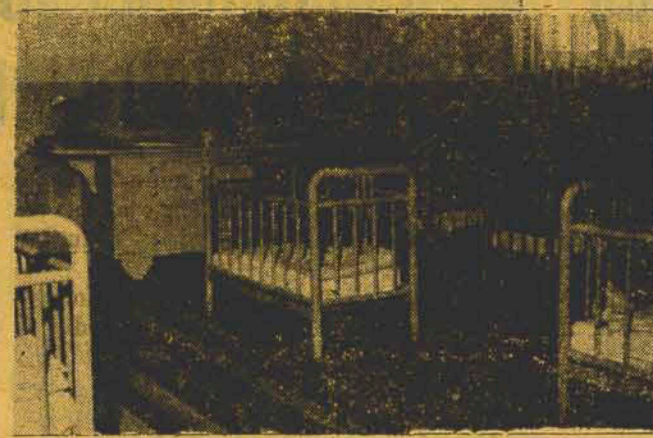
Um cantinho do bercário do Preventório Santa Catarina — estabelecimento por tudo modelar e que honra nossa terra

Dado o espírito de compreensão do povo catarinense, é de prever-se o grande número de dádivas que serão enviadas àquela casa.