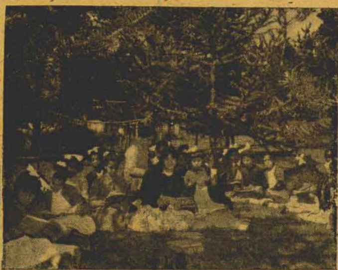
Foto 2 — A fim de intensificar o contato das crianças com a natureza, são ministradas aulas ao ar livre. No Preventório Santa Clara há 300 crianças internadas, sendo 60 meninos e 240 meninas e adolescentes.

Num imenso parque vemos cerca de 300 crianças brincando ruidosamente. Sons cristalinos de vozes infantis são ouvidos ao longe. Ninguém poderia, no entanto, suspeitar que o perigo de uma terrível moléstia pende sobre suas cabecinhas. E que aqueles altos muros que as cercam são de uma instituição de caráter profilático e preventivo. Uma instituição que protegendo-as contra o perigo da tuberculose, contribui de modo decisivo para a luta que hoje se trava em nosso país para estirpar de nossas fronteiras o mal que anualmente mata cerca de 100.000 brasileiros. A tuberculose é uma doença complexa. Seu tratamento — graças aos progressos da medicina no setor da fisiologia — consegue ótimos índices de recuperação de infectados, mas é lento e demorado. Seu poder de contágio é imenso. Suas causas são ao mesmo tempo fisiológicas e sociais. E suas consequências são tão vastas que se calcula que mais ou menos 1 milhão de brasileiros tem sua capacidade realizadora diminuída ou neutralizada pela doença.