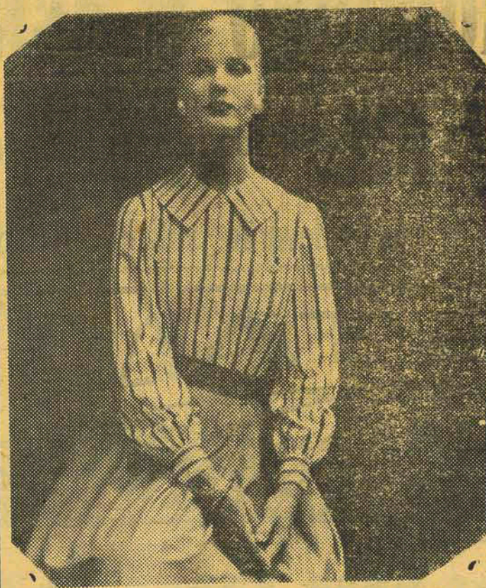
Uma blusa encantadora de SIMPLICITY PATTERN. Blusas largas e estreitas, uma gola grande bem assentada e dois grandes bolsos. Mangas compridas, franzidas na cava e nos pulsos. Abotoada na frente e os bolsos também tem botões.