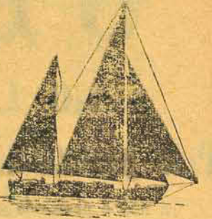
COMISSÃO DE REGATAS À VELA:

A Comissão de Regatas à Vela, e composta de elementos representativos dos Clubes participantes sob a presidência do presidente da Federação. Os elementos componentes de uma Comissão de Regatas, deverão ser além de tudo bons desportistas e agir quando for necessário com toda imparcialidade e de acordo com a consciência. Deve ser exigido pelo presidente de uma Comissão de Regatas, que os componentes da mesma, tenham si não amplos conhecimentos das REGRAS DE REGATAS À VELA, que sejam ao menos clareados no assunto e não verdadeiros leigos.