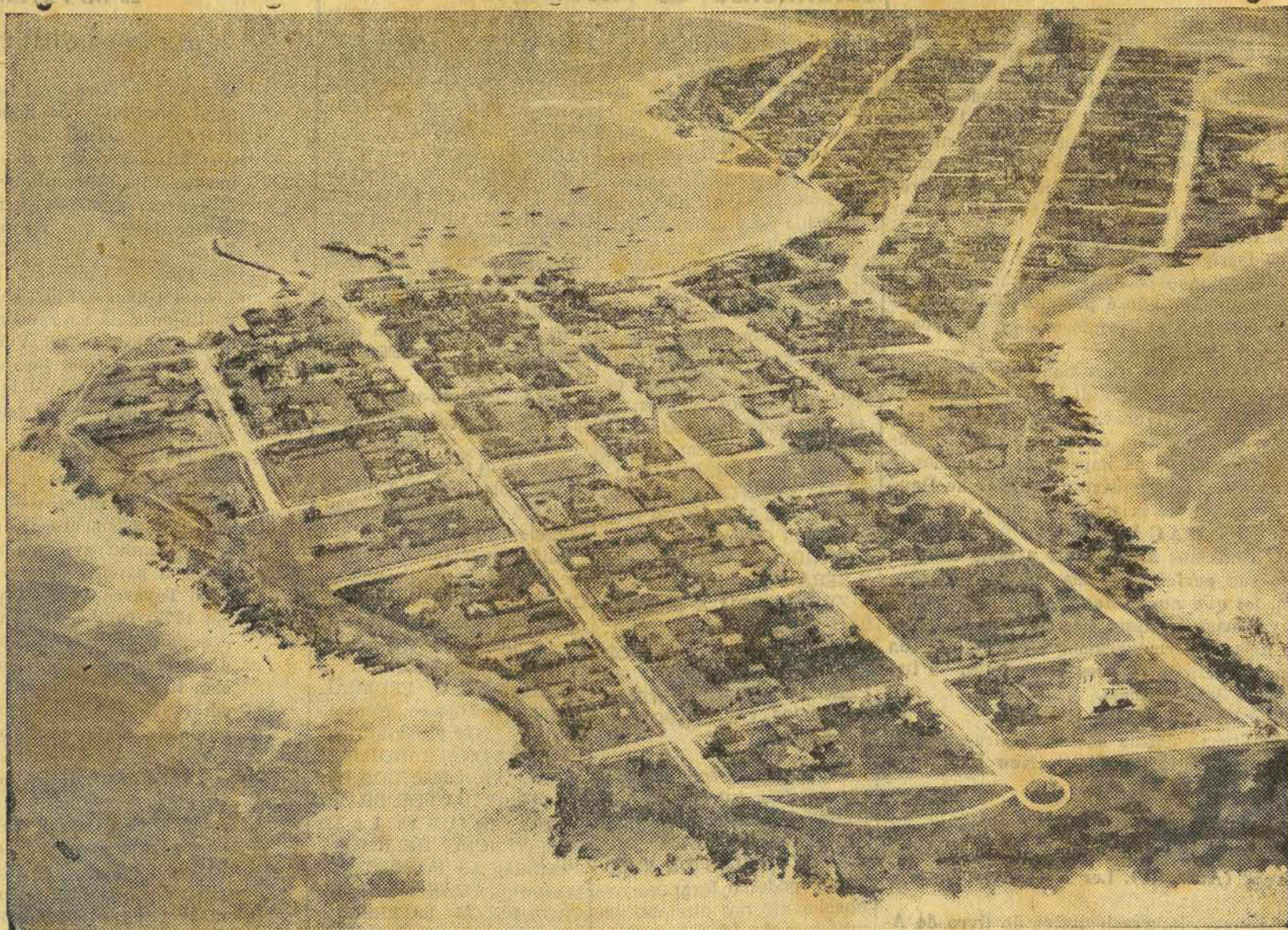
PUNTA DEL ESTE: RECANTO PARADISIACO DO ATLANTICO, JUSTA ATRAÇÃO MUNDIAL