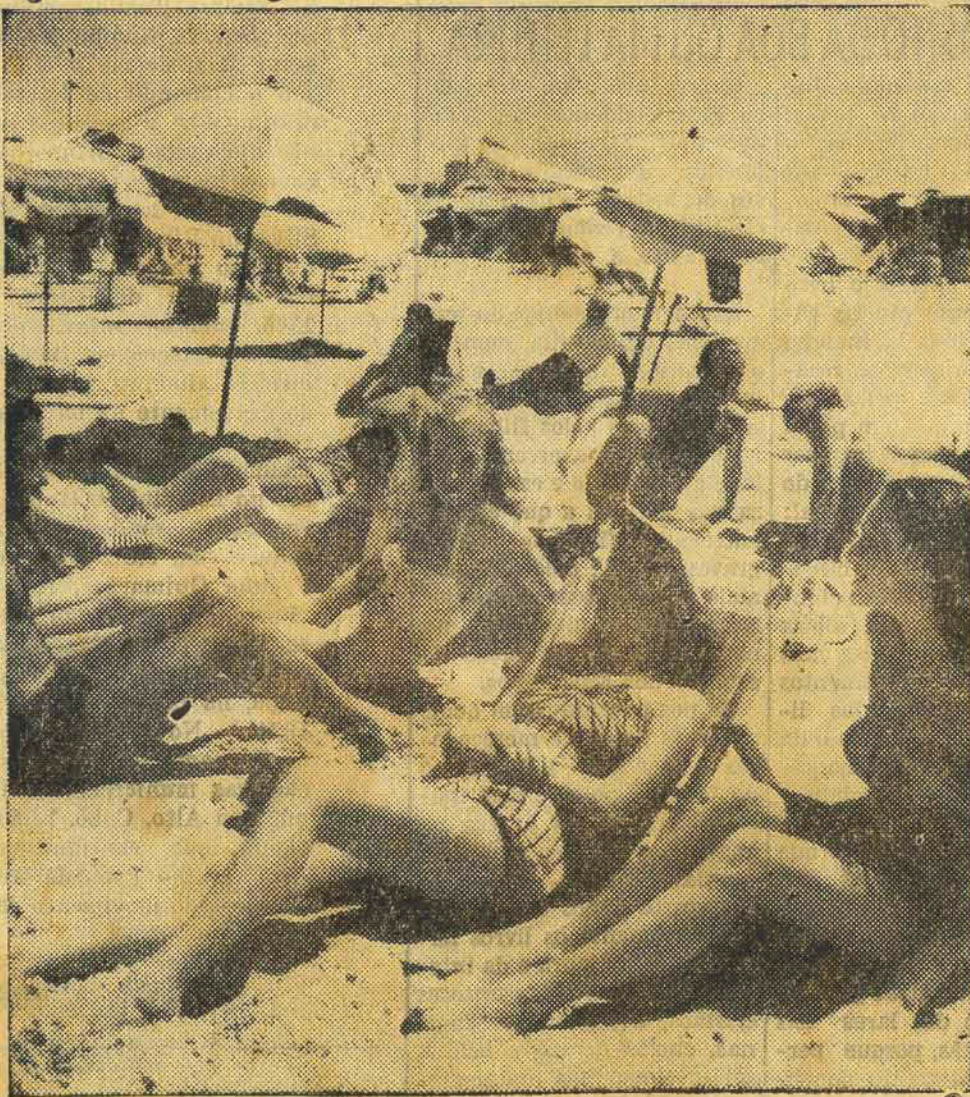
PUNTA DEL ESTE: JUVENTUDE E BELEZA NA PRAIA

"O JARDIM DA AMÉRICA" Informações sobre viagem ao Uruguay nas agências de turismo ou nos escritórios da Representação Turística Uruguia para o Brasil: