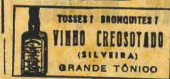
TOSSEI? BRONQUITES? VINHO CREOSOTADO (SILVEIRA) GRANDE TÔNICO