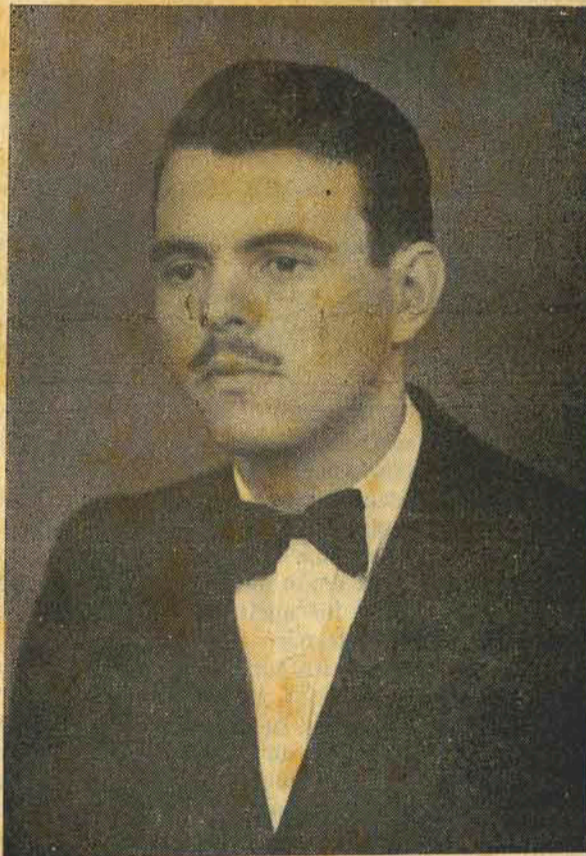
Um Jovem estreando na Vida Publica