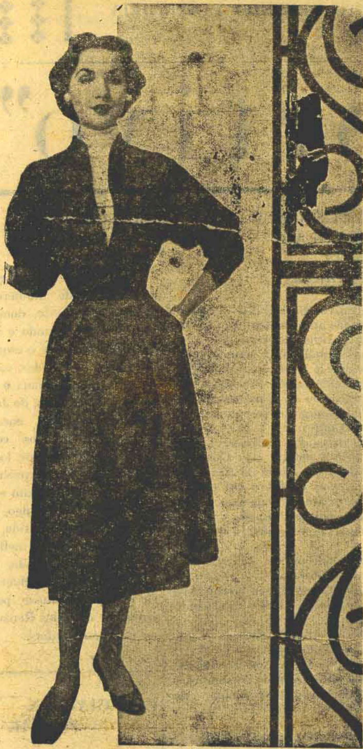
Um vestido escuro, com saia ligeiramente rodada e corpo aberto na frente para ser usado com echarpe ou peitinho. Mangas três quartos bem folgadas. (APLA)