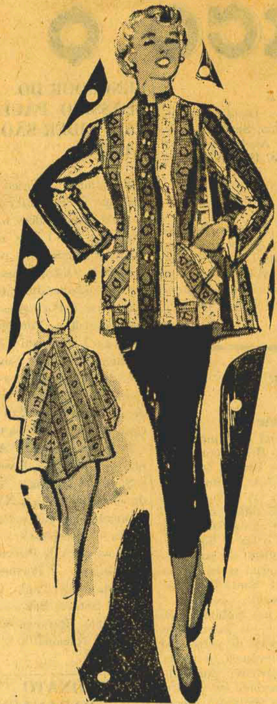
Bata em algodão xadrêz, com dois bolsos que a tornam muito cômoda para as compras. (APLA)