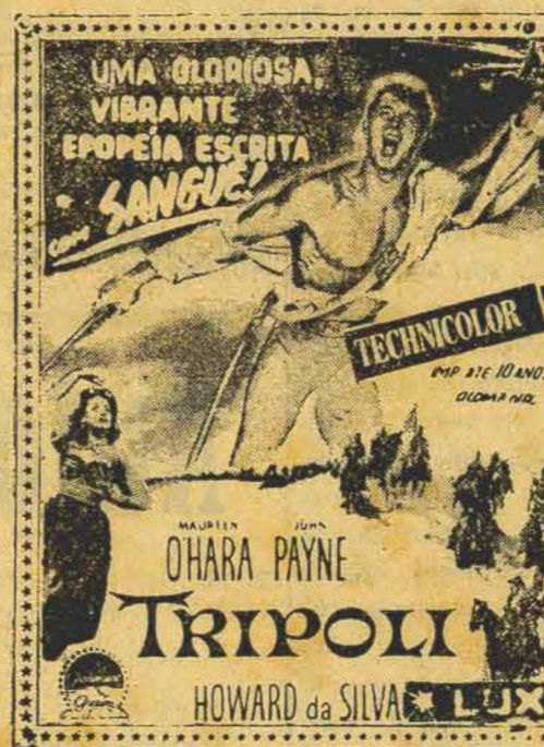
TRIPOLI Com: John Payne — Maureen O'HARA (Technicolor)