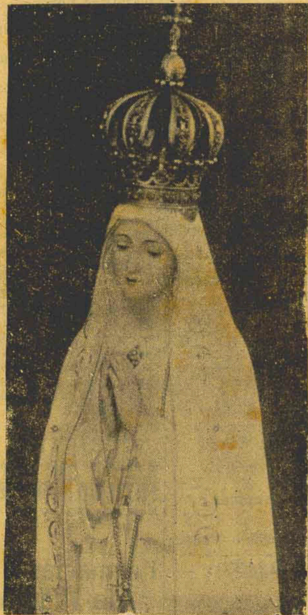
Nossa Senhora da Fátima que, desde ontem, está sendo homenageada pelo povo e autoridades catarinenses

— Quase que o sr. vira cadáver! — Vivo ou morto?