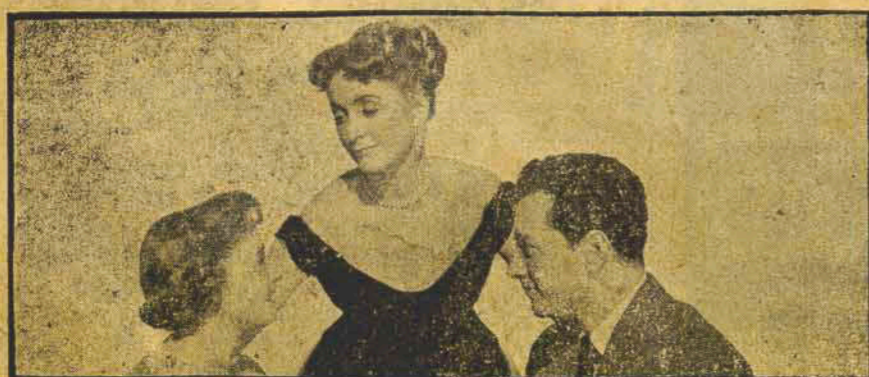
RICA, MOÇA E BONITA Com: Jane Powell — Vic DAMEM