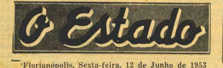
Florianópolis, Sexta-feira, 12 de Junho de 1953