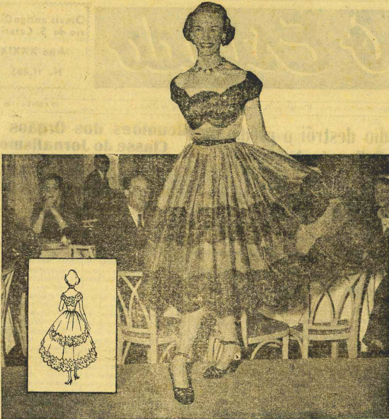
Atraente modelo em organdi suíço cinza, enfeitado com renda "chantilly" preta, na saia e no gracioso decote. Modelo de Anne Verdi, N. Y.

São esses os fatos observados dia por dia, numa pele sujeita ao tratamento pelo "peeling", sem dúvida,