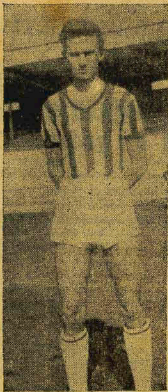
BOOS, PIVOT AVAIANO

“azzurra” deixou a desejar no prélio com o Figueirense, por pouco não sofrendo