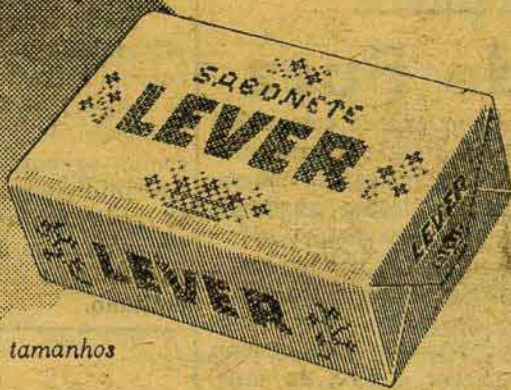
Em 2 tamanhos

Seja você também mais adorável usando o novo Lever com o seu romântico perfume para mais sucesso... a sua pureza imaculada para uma cutis mais avulada... e também a sua espuma rápida para mais economia!