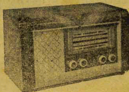
Modelo ARC 515