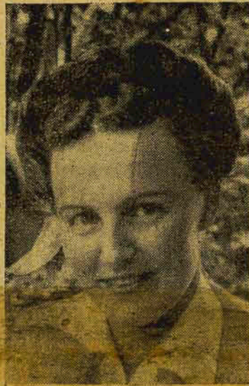
A nossa sociedade, amanhã, no Clube Doze de Agosto, significará os seus aplausos e o seu apre-