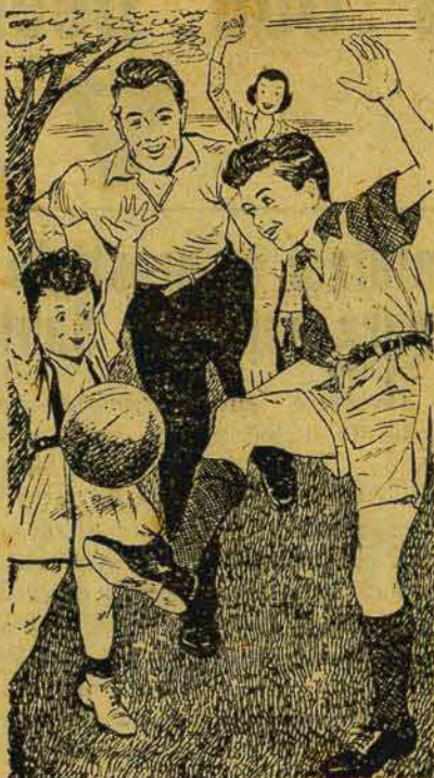
Ar fresco, exercício, boa alimentação e vida moderada contribuem para evitar a Tuberculose.

Proteja-se contra o germe da Tuberculose