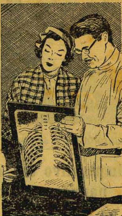
Os Ratos-X revelam a Tuberculose no seu começo — quando a cura é mais fácil.

Esterilize as louças, roupas etc., usadas por um tuberculoso