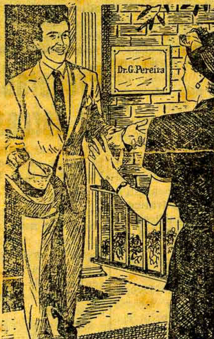
Convença-se — e diga a outros — de que a Gonorréia e a Sífilis podem ser curadas!