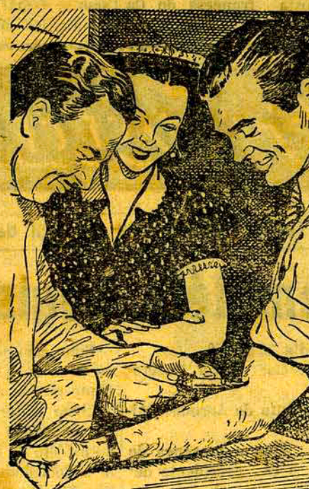
As doenças venéreas podem ser evitadas. Pergunte como, ao seu médico!

Novas drogas encurtam o período de tratamento. Se a Sífilis e a Gonorréia forem tratadas a tempo, elas podem ser, quase sempre curadas. Mesmo nos últimos estágios o tratamento diminui o sofrimento. E novas drogas podem agora curar a Sífilis e a Gonorréia numa fração do tempo até há pouco necessário. Peça ao seu médico informações sobre estes novos tratamentos. Ficará surpreendido com as boas novas que ele tem para Você.