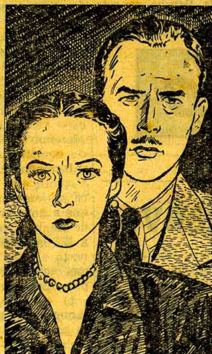
A Sífilis é chamada "A Grande Imitadora" porque seus sintomas são, freqüentemente, semelhantes aos de outras moléstias.