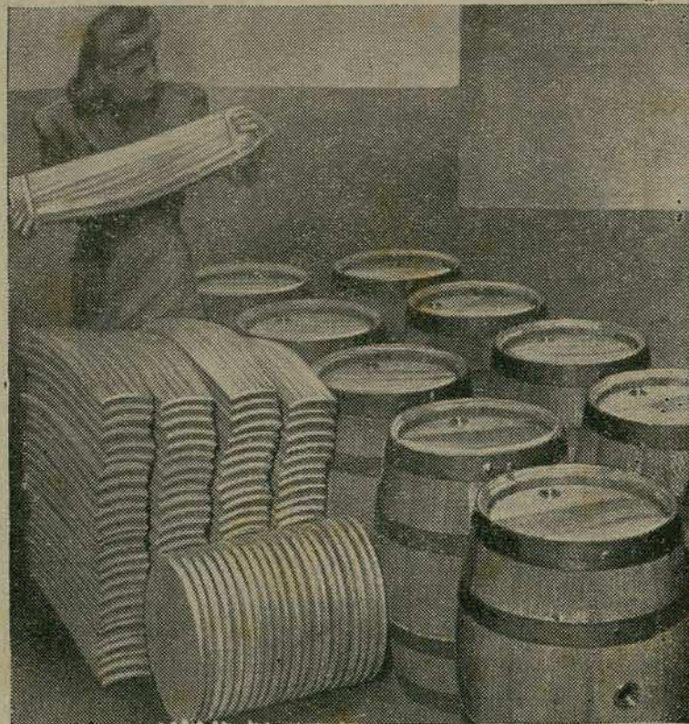
BARRIS DESMONTÁVEIS — A fim de diminuir as despesas de transporte e aumentar a vida dos barris, uma fábrica britânica acaba de lançar um modelo de barril desmontável, feito de madeira compensada, forrada interiormente de carvalho. (British News Service).

Florianópolis, 9 — Jubilosas agradecemos o louvável gesto da apresentação à Assembléia Legislativa dos projetos de criação das carreiras de Diretor de Grupo e de Inspetor Escolar. (a) Diretora e professoras do Grupo Escolar Arquidiocesano S. José".