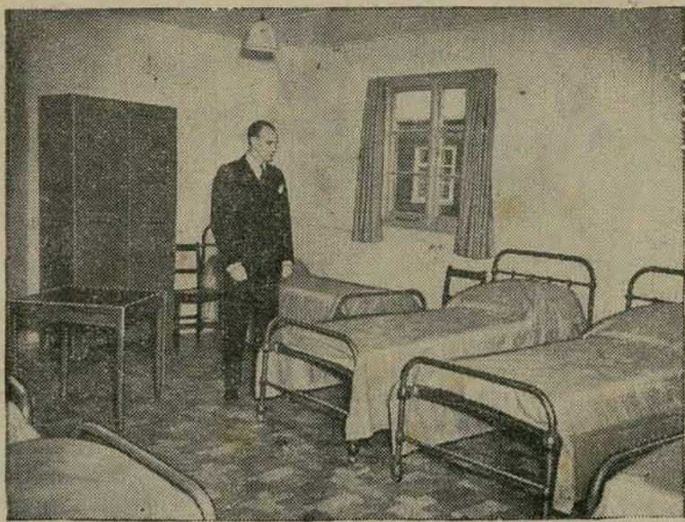
ACOMODAÇÕES PARA OS ATLETAS OLÍMPICOS — O presidente do Comité de Instalações das Olimpíadas, inspeciona um dos dormitórios destinados aos atletas olímpicos, em Londres.