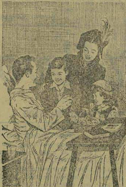
Milhares de pessoas anualmente são salvas da morte por pneumonia, graças a modernos medicamentos.