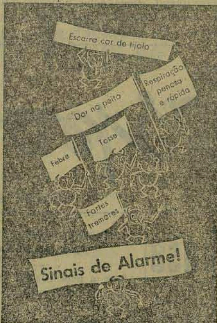
Tome nota destes sintomas alarmantes. Se qualquer deles se manifestar, chame imediatamente o médico! Enquanto isso, permaneça deitado e em absoluto repouso!