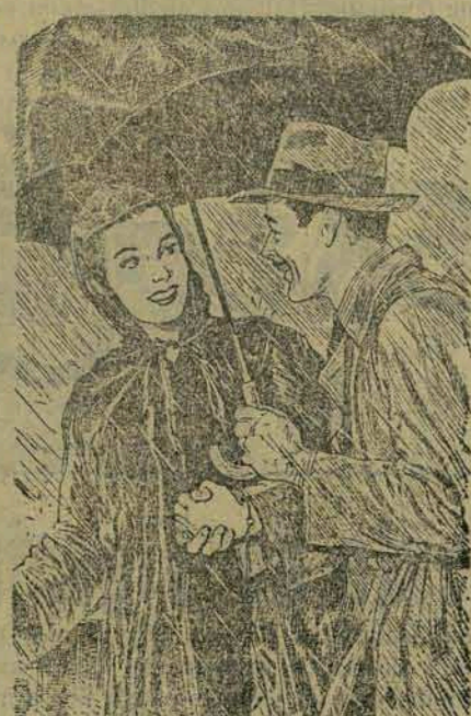
Cuide inteligentemente da sua saúde! Evite expor-se inutilmente, mantendo-se sempre bem agasalhado!

Mas, há um "se"... Quando seus pais ainda eram pequenos, os casos de pneumonia tinham apenas metade das probabilidades que você hoje tem de escapar. Agora, graças aos novos medicamentos, a maioria dos casos é curável... se o tratamento for feito logo no início e sob assistência médica.