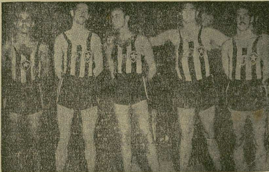
ILUSTRA A PÁGINA O FAMOSO "FIVE" DO BOTAFOGO DE FUTEBOL E REGATAS, QUE RECENTEMENTE LAUREOU-SE TETRA-CAMPEÃO CARIOCA DE BASQUETEBOOL. SEGUNDO A CRITICA, OS JOGADORES QUE AQUI VEMOS, SÃO OS MAIS EXIMIOS "CESTINHAS" DA AMERICA DO SUL. ESTE O CONJUNTO QUE SE EXIBIRÁ EM NOSSA CAPITAL, NOS DIAS 25, 27 e 28 DO CORRENTE A CONVITE DA F. A. C.