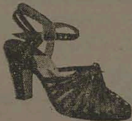
Lindo sapato em pelica, preta, azul, bordô, salto 4 1/2, 5 1/2 e 6 1/2 por Cr$ 98,00