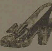
Lindo sapato em búfalo branco, salto carioca Cr$ 90,00 Em pelica, azul, preto, havana, Por Cr$ 80,00