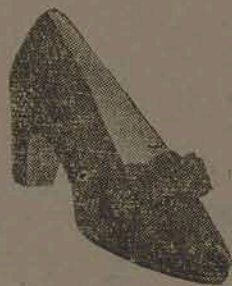
Em fina camurça preta, azul e branco, salto 4, 4 e meio 5 e 6 por Cr$ 95,00

Apresenta seus últimos modelos em calçados finos para senhoras