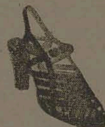
Em pelica, marron, preta, azul e búfalo branco salto 4, 6 e 7 Por Cr$ 98,00