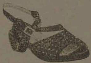
Em camurça bordô, preta, e búfalo branco, salto rampa 2 1/2 Por Cr$ 95,00