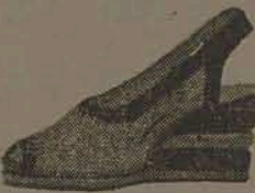
Finíssima tela azul, preta, branca e bordô, guarnições em camurça, salto Anabela 6 e meio por Cr$ 108,00