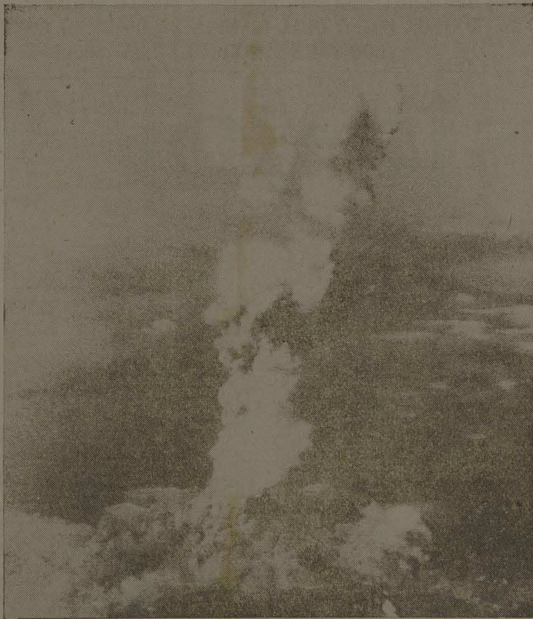
Imediatamente após haver sido lançada a primeira bomba atômica por uma Super-Fortaleza norte-americana, levantou-se uma coluna de fumaça a vários quilômetros de altura a bomba atômica destruiu por completo a base de Hiroshima. (S. I. H.)

"Um amigo é um homem que sempre se encontra quando dele necessitamos, e está sempre ausente, sobretudo, quando não necessitamos dele".