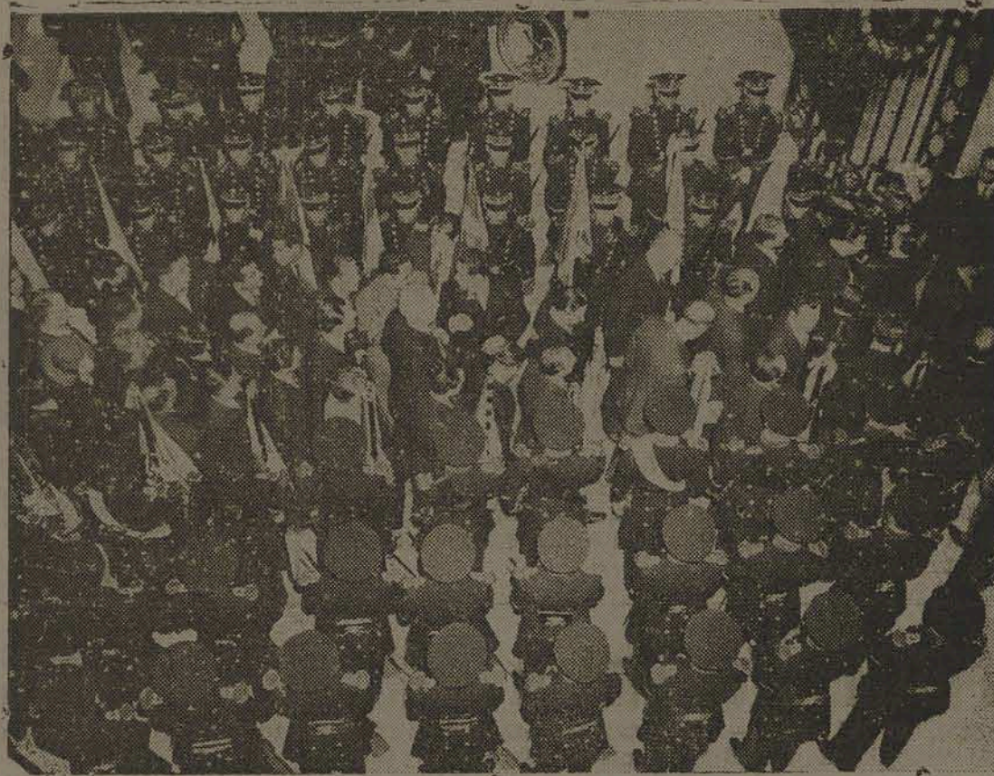
A Guarda de Honra formada na frente da Câmara dos Deputados, na cidade do México, no momento em que saíam os delegados que assistiram a Sessão Inaugural da Conferência Inter-Americana sobre os problemas da guerra e da paz.

ques de vermes e traças, sua superfície não retarda a ventilação, pode ser completamente lavado com água e sabão, não possui molas que frequentemente se quebram e perfuram o envoltório, "respira" constantemente quando em uso, possui raras qualidades emortecedoras de choques e vibrações, bem como milhões de células interconexas que mantêm o produto fresco". A borracha esponjosa está longe de ser uma descoberta nova. Seu princípio data de um incêndio acidental ocorrido numa fábrica de borracha da Inglaterra por volta de 1850. O calor do fogo evidentemente fez com que o produto químico (que os industriais da borracha aqui não sabem qual seja), empregado na solidificação do latex, se transformasse numa espécie de esponja. Deste produto desenvolveu-se uma borracha esponjosa obdida por processos químicos, comumente conhecida como esponja de banho. (965).