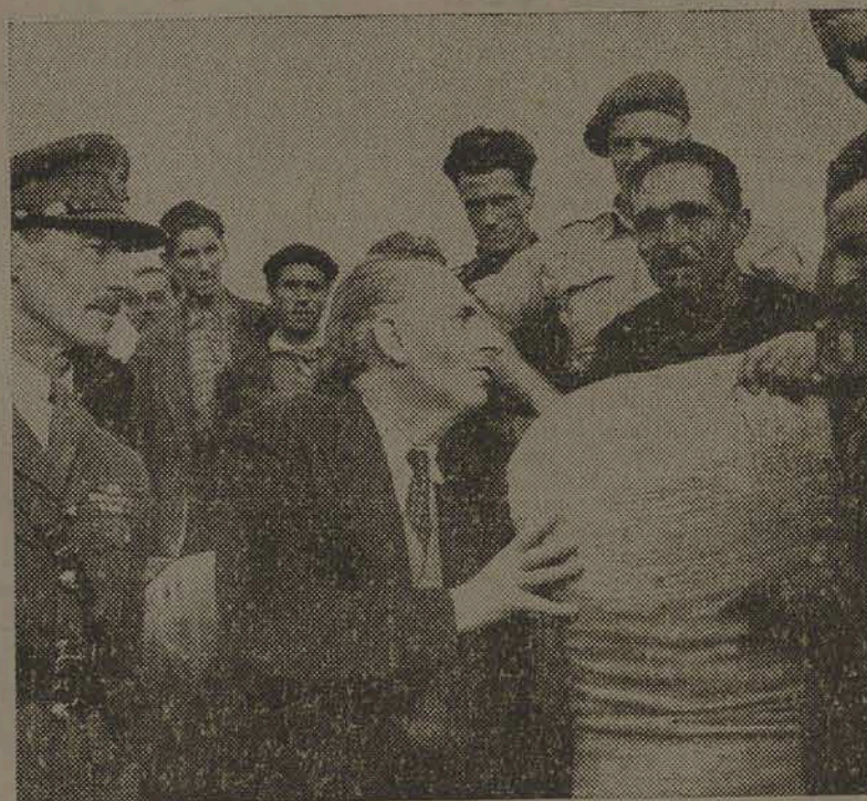
Na fotografia vemos o Ex Primeiro Ministro grego M. Papandreou ajudando a descarregar um saco de trigo. Ao seu lado vemos o Tenente General Scobie.