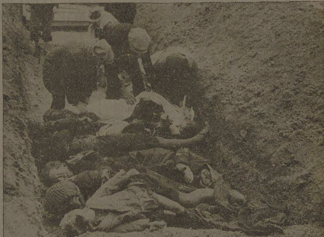
Civis belgas mortos por soldados alemães quando eram obrigados a retirar-se de uma aldeia atacada por fôrças norte-americanas.

As anedotas e piadas aparentemente ingênuas são grandes armas de desagregação manejadas pela "quinta-coluna"