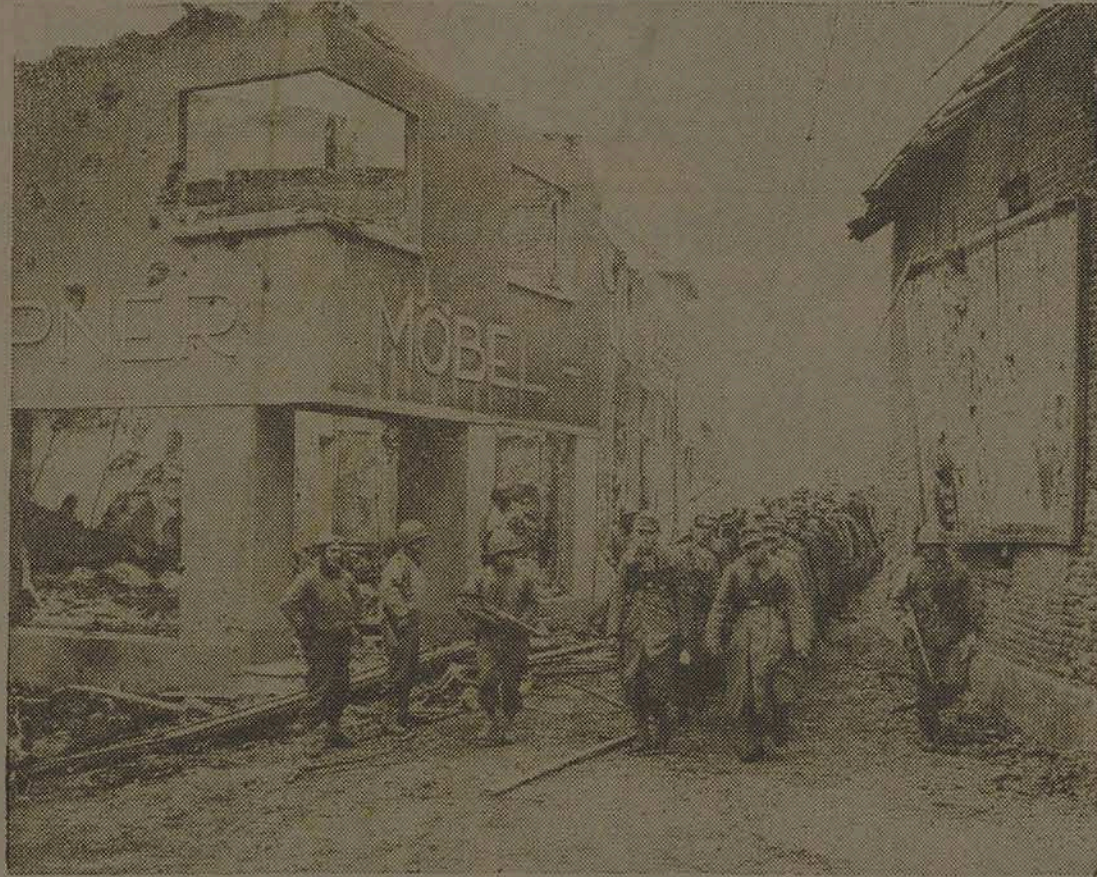
Escoltados por soldados norte americanos, prisioneiros alemães marcham por uma rua de Palembang, a caminho de um campo de concentração. (Serviço de Informações do Hemisferio).

CASA MISCELANEA distribuidora dos Rádios R. C. A. Victor, Válvulas e Discos. Rua Conselheiro Mafra, 10.