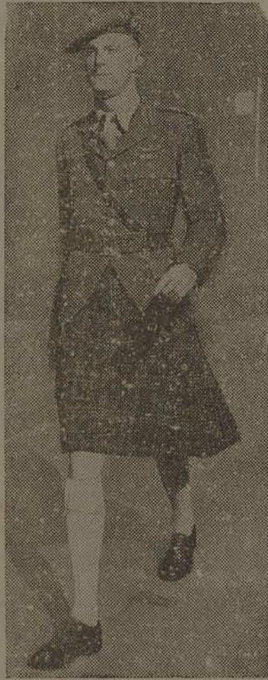
De volta de uma missão de paraquedistas às linhas do General Tito, vemos o Brigadeiro MacLean passando nas ruas de Londres.