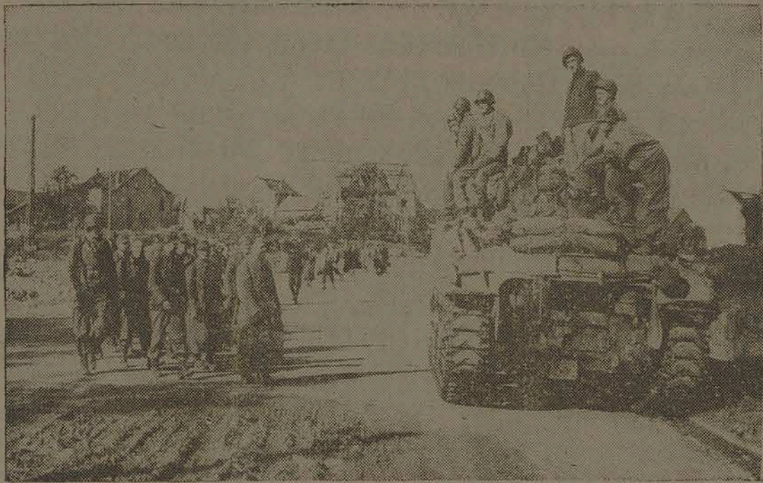
Rendição de um pelotão alemão em Aachen, Alemanha.

Nova Iorque, janeiro (S. I. H.) — Os Estados Unidos precisam comprar mais em matéria de suas importações tropicais da América Latina — disse em discurso pronunciado perante o Instituto da Reconstrução de Após-Guerra, da Universidade de Nova Iorque, o dr. Carlos Davila, antigo embaixador chileno nos Estados Unidos. "Antes da guerra, os Estados Unidos compravam 94 por cento de suas importações tropicais — a maioria delas materiais estratégicos — no Extremo Oriente, a 10.000 milhas de distância, e não na América Latina" — disse o dr. Davila. "Agindo daquela maneira, os Estados Unidos estavam deixando um saldo favorável de mais de 350.000.000 de dólares anuais para o Extremo Oriente, enquanto deixavam um saldo desfavorável para a América Latina, onde a Norte América tinha um interesse sete vezes mais nos investimentos e um interesse político cem vezes maior. Para por um fim a essa desastrosa situação, foi criada a Comissão de Desenvolvimento Inter-Americana, em janeiro de 1940". "Não tenho nenhuma dúvida de que por medida de vantagem econômica ou de segurança militar deste país, os Estados Unidos deveriam continuar a comprar na América Latina, e não no Extremo Oriente, quando a América Latina puder fornecer os produtos" — concluiu o dr. Davila.