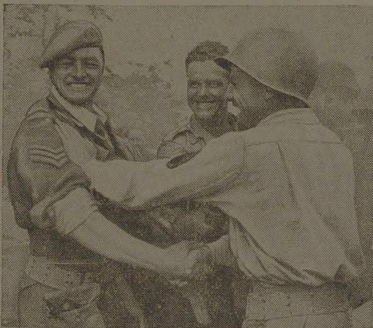
Um sargento britânico congratula-se com um companheiro do mesmo posto do Exército Americano na junção das tropas do 5º Exército com as forças da inolvidável cabeça de ponte de Anzio.

É preferível, no entanto, que seja mesmo assim. Porque, assim, não escapará ao castigo merecido todo aquele que tem uma parcela de responsabilidade na catástrofe que a contragosto vivemos. E, afinal, serão totalmente eliminados os eternos perturbadores da paz mundial.