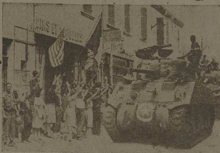
Tropas estadunidenses que tomaram parte na libertação do sul da França entram em uma localidade perto de Toulon. O povo, desfraldando bandeiras da França e dos Estados Unidos, saudava estrondosamente os seus libertadores.

Abona as melhores taxas para Depósitos, Descontos, Cobranças e Passes Correspondentes em tôdas as praças do País.